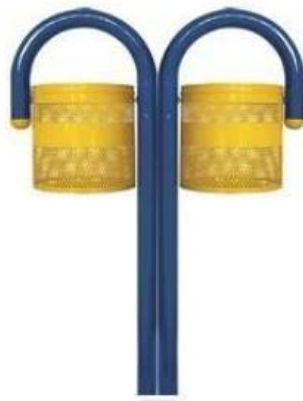
Modelos de lixeira

A lixeira deve ser em aço carbono com pintura em pó eletrostática, suporte de tubos de aço carbono, de altura mínima de 140 cm, com dois cestos de 60 litros cada em aço carbono com pintura em pó eletrostática. Será fixada em blocos de concreto de dimensões mínimas de 30 x 30 x 40 cm (comprimento x largura x altura).