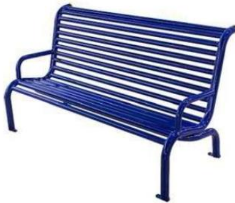
Modelo de banco

Os bancos a serem instalados, são fabricados com tubos de aço carbono de no mínimo 2" x 2,00mm e 1 ½" x 1,50mm; chapa de no mínimo 2,00mm para fixação do equipamento. chumbador parabout de no mínimo 3/8" x 2 ½"; tratamento de superfície a base de fosfato; película protetiva de resina de poliéster termo-endurecível colorido com sistema de deposição de pó eletrostático, solda mig. No mercado existem bancos com encosto, em aço carbono, com comprimento variando de 1,50 metros a 1,60 metros.