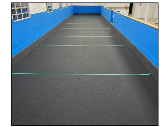
FELTO / CARPETE ESPECÍFICO PARA CANCHA DE BOCHA, COR GRAFITE 100% POLIÉSTER ESPESSURA: 2,3 MM GRAMATURA: 470 GR/M2