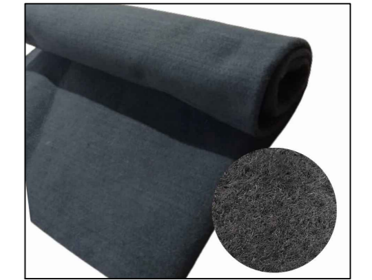
FELTO PARA CONTRAPISO ESPECÍFICO PARA CANCHA DE BOCHA 100% POLIÉSTER ESPESSURA: 3 MM GRAMATURA DE REFERÊNCIA: 350 GR/M2