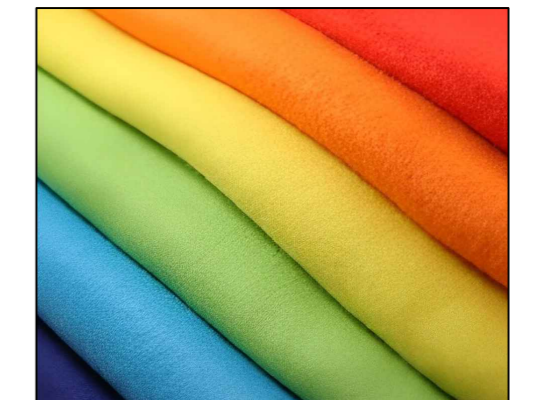
FELTO / CARPETE COLORIDO - PARA REVESTIMENTOS LATERAIS, CORES VERMELHO E VERDE BANDEIRA 100% POLIÉSTER ESPESSURA: 1 MM GRAMATURA DE REFERÊNCIA: 180 GR/M2