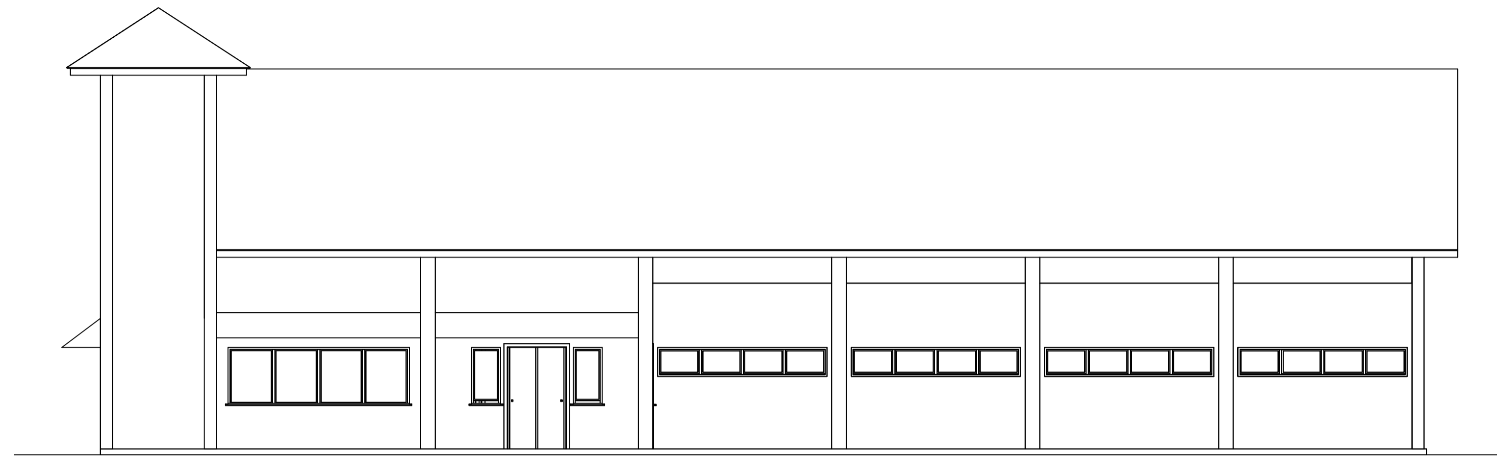
ELEVAÇÃO FRONTAL SEM ESCALA