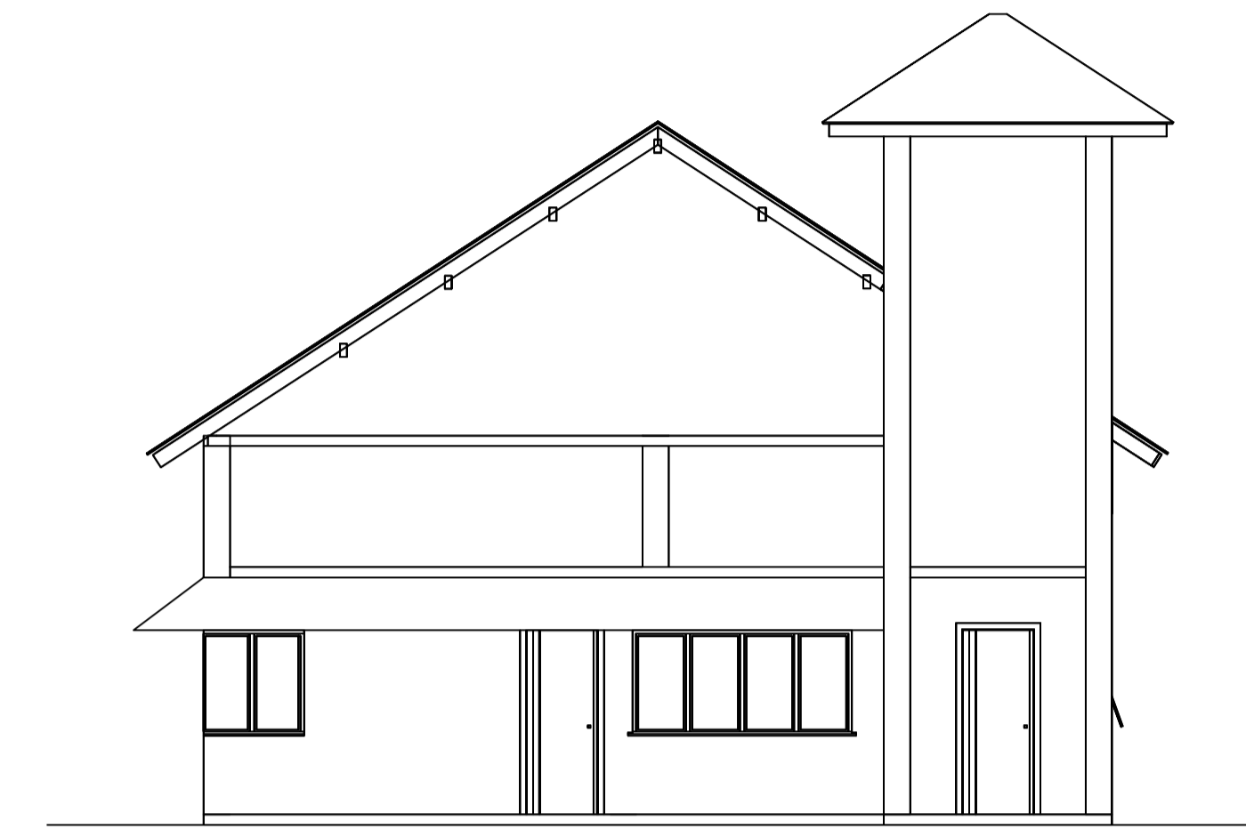
ELEVAÇÃO LATERAL SEM ESCALA