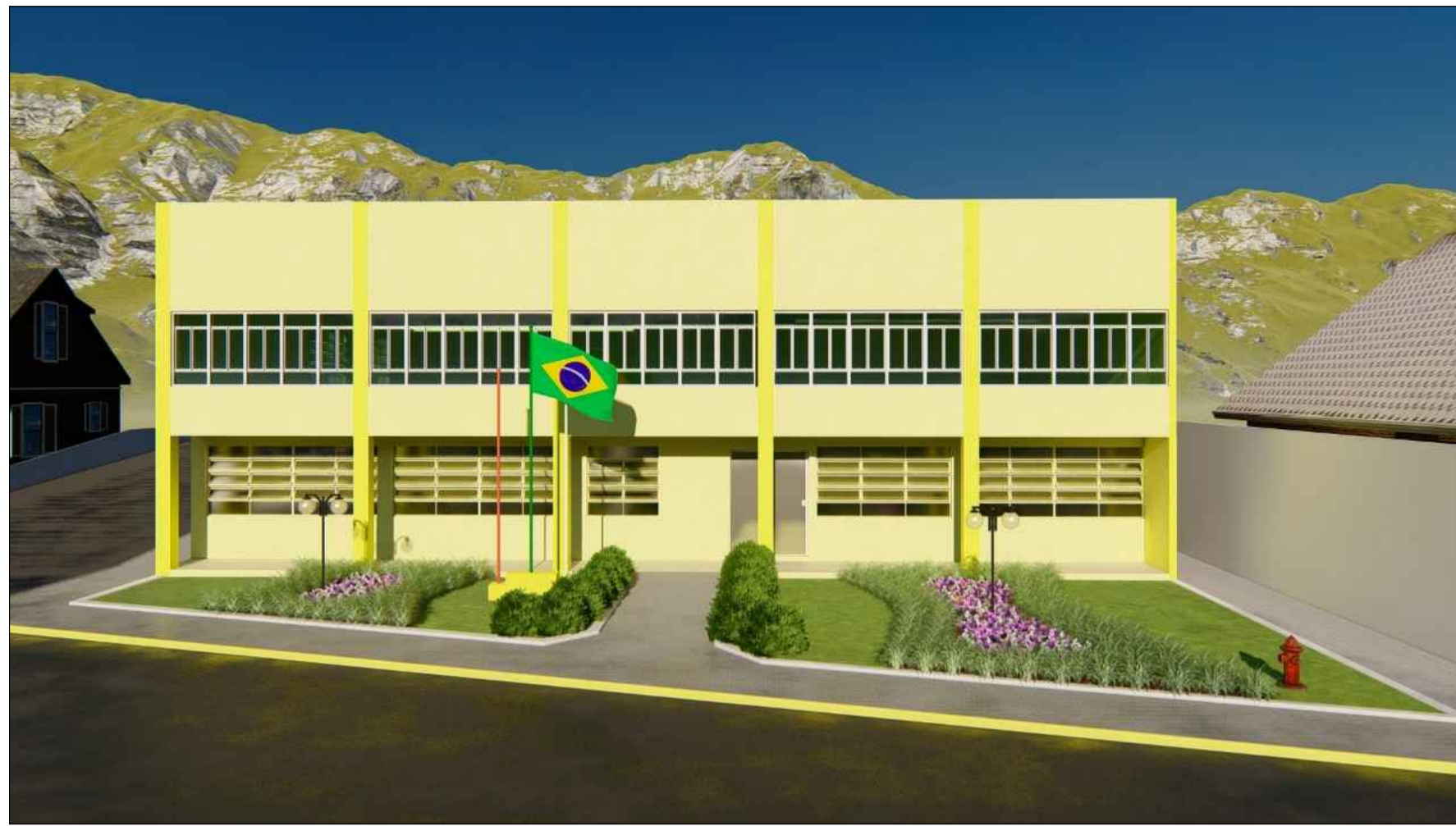
PERSPECTIVA 3D SEM ESCALA