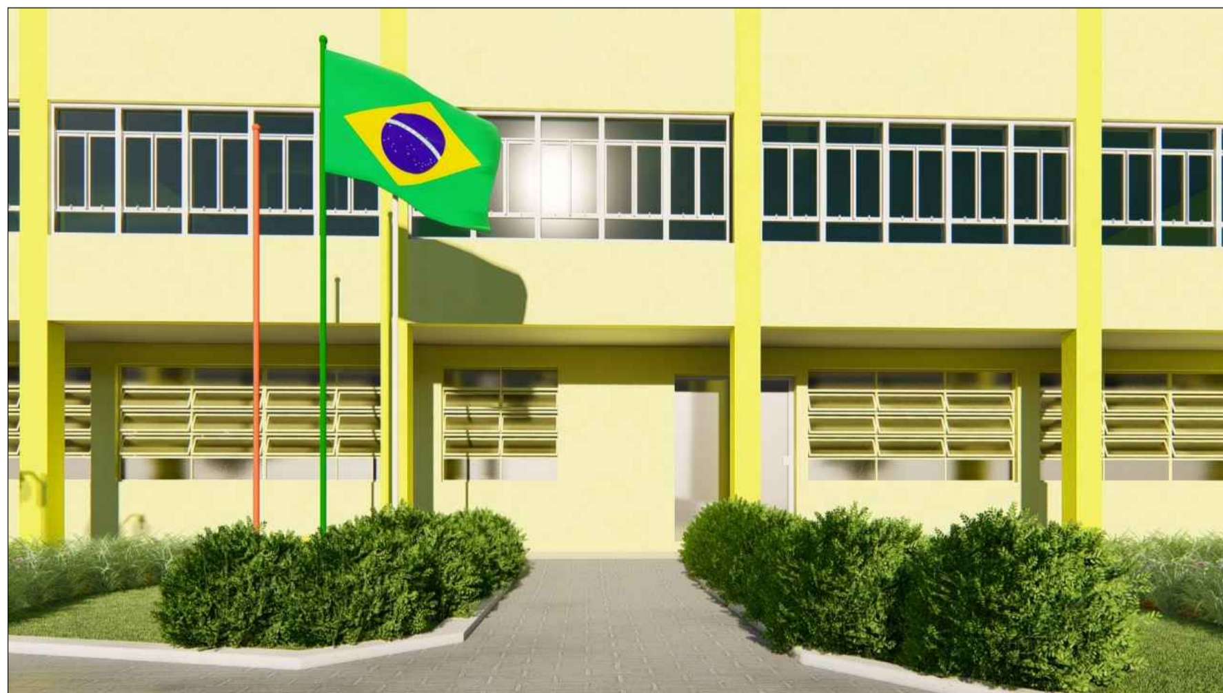
PERSPECTIVA 3D SEM ESCALA