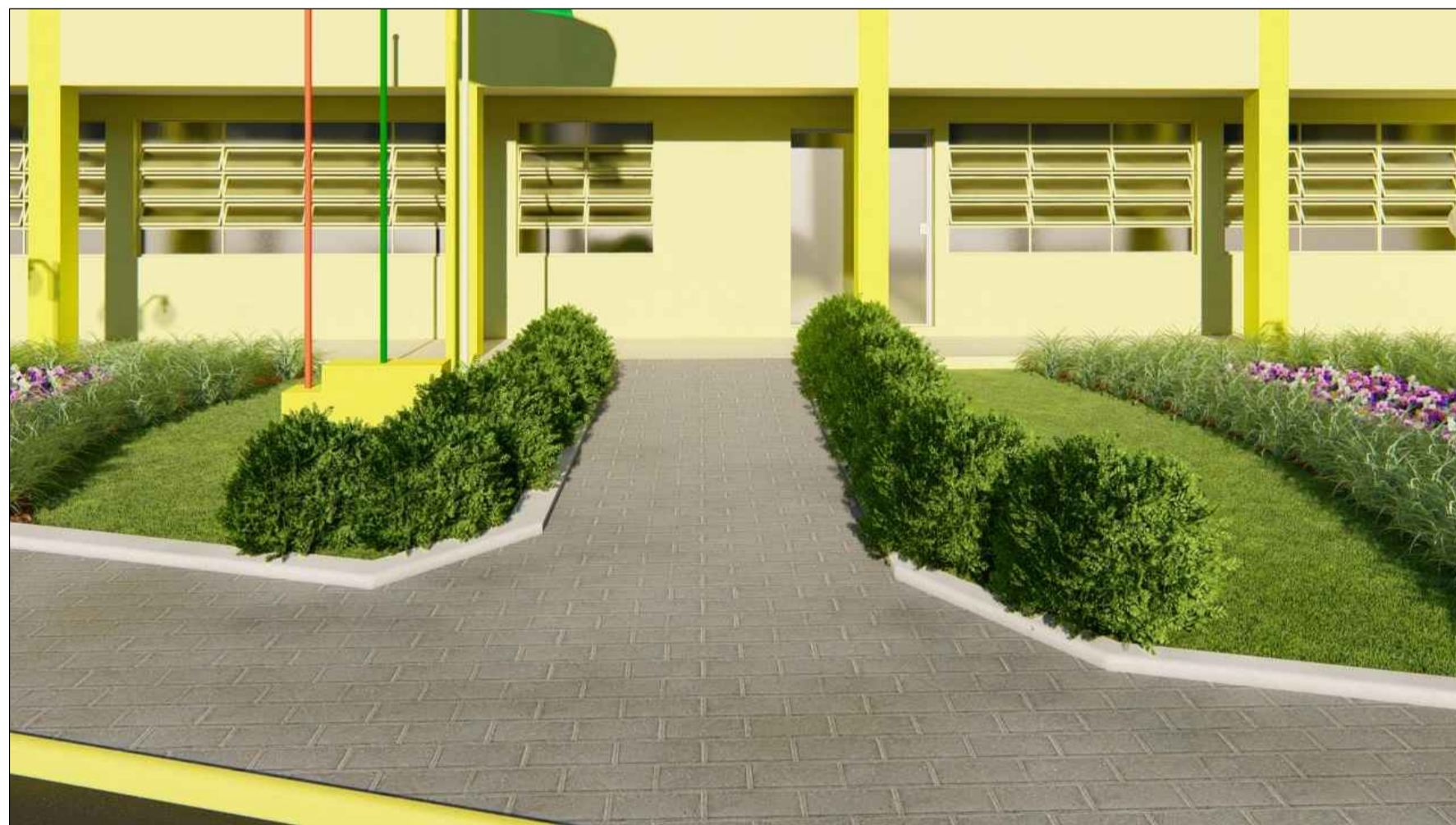
PERSPECTIVA 3D SEM ESCALA