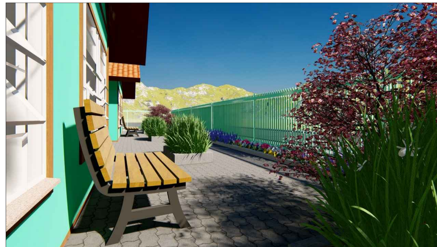
PERSPECTIVA 3D SEM ESCALA