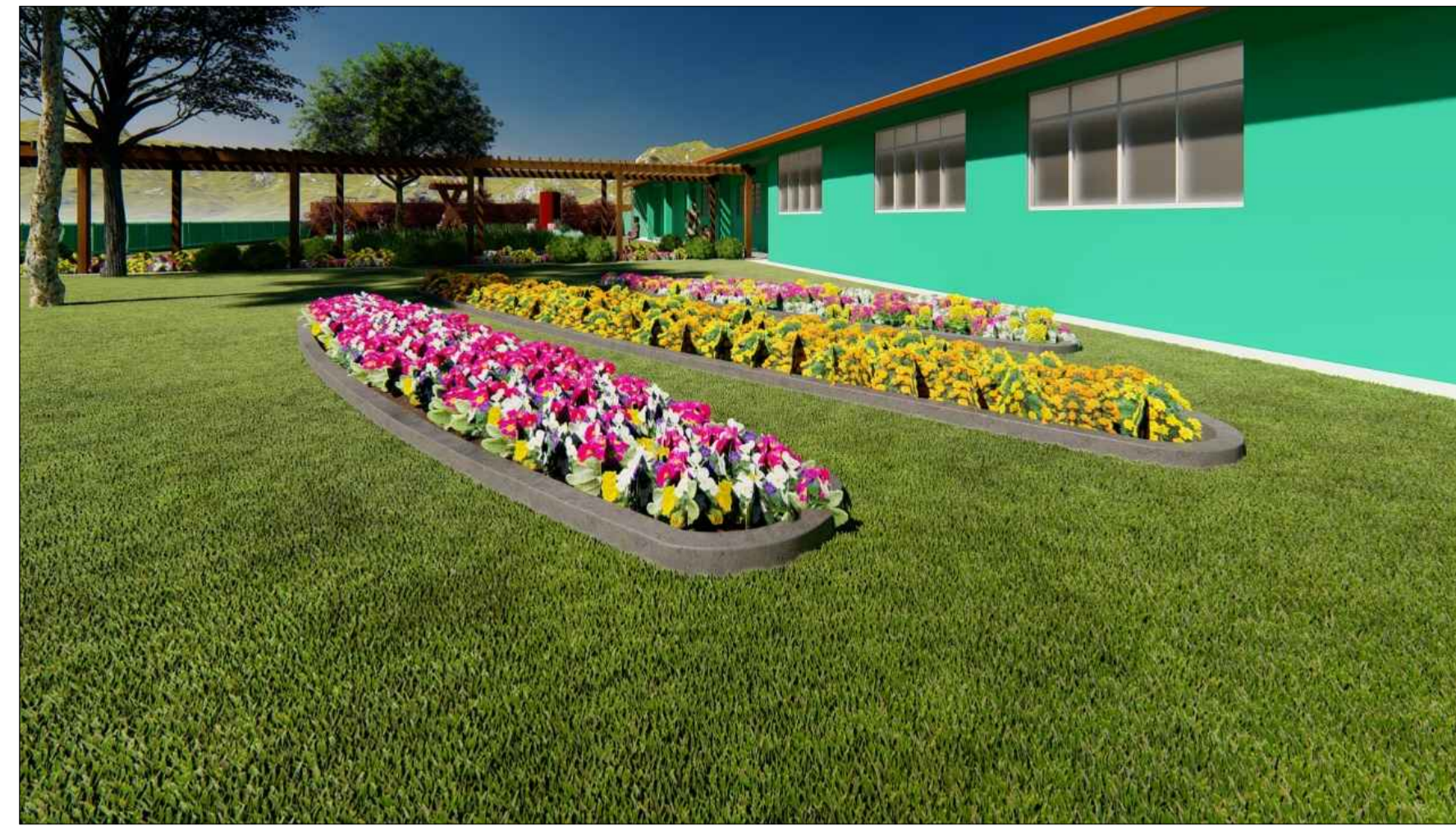
PERSPECTIVA 3D SEM ESCALA