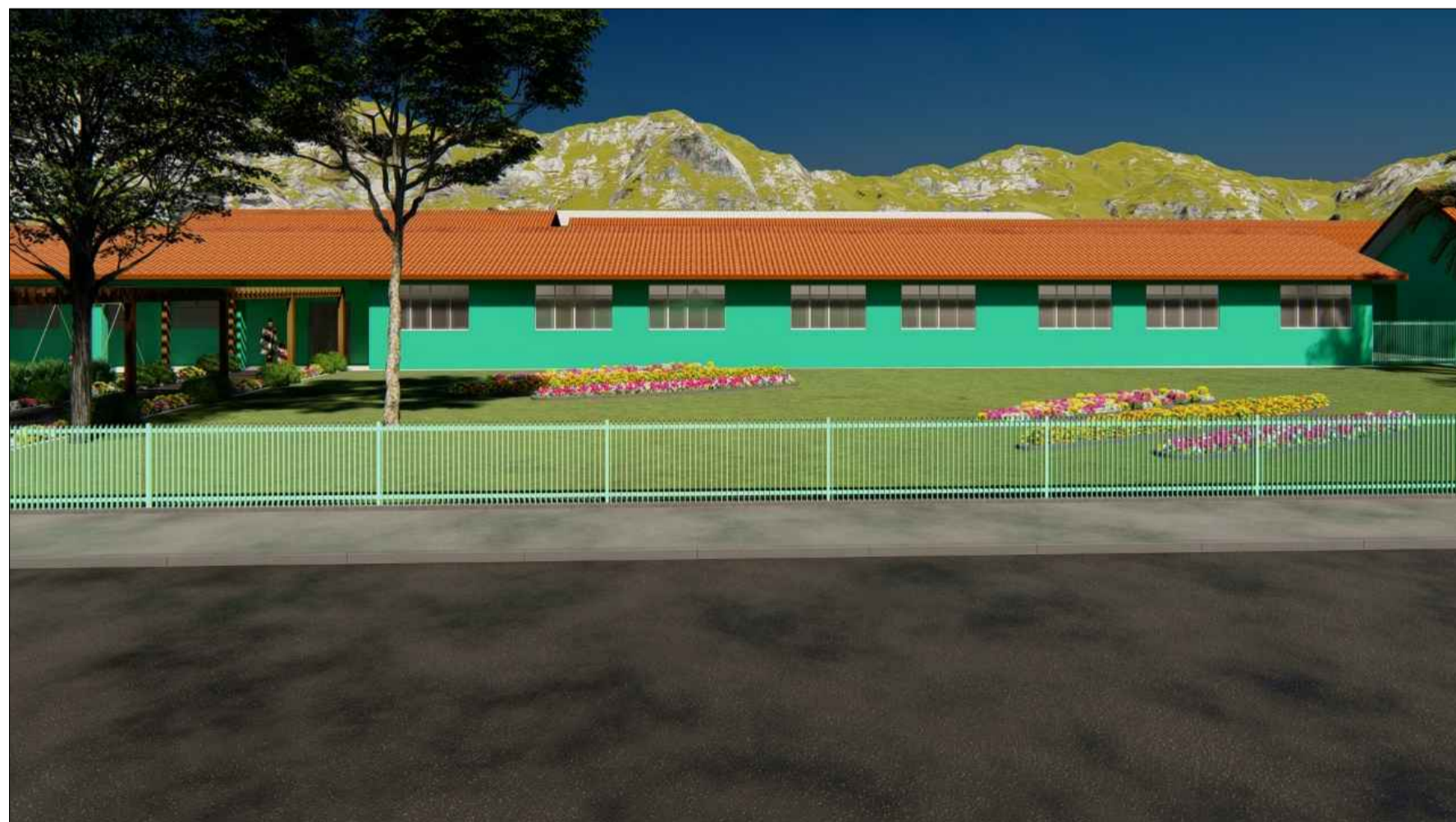
PERSPECTIVA 3D SEM ESCALA