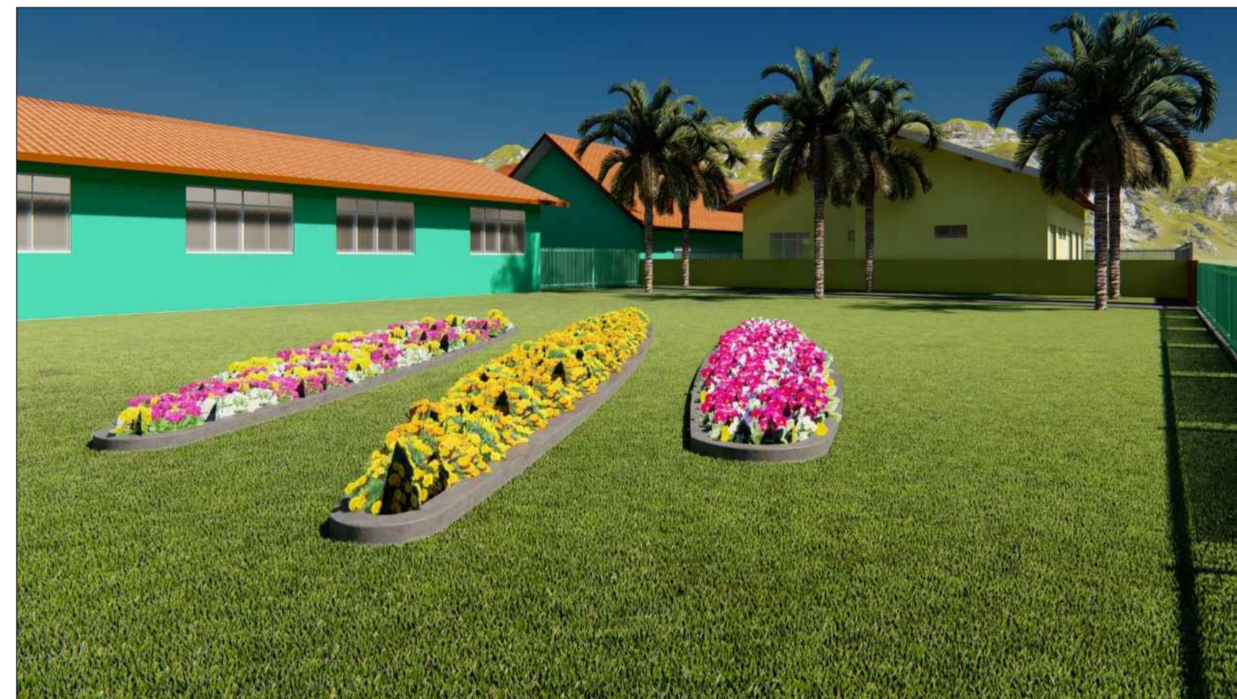
PERSPECTIVA 3D SEM ESCALA