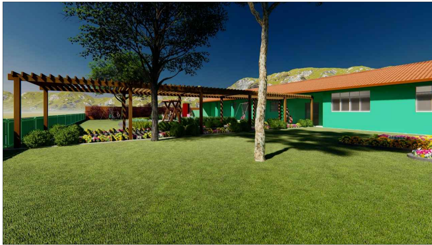
PERSPECTIVA 3D SEM ESCALA