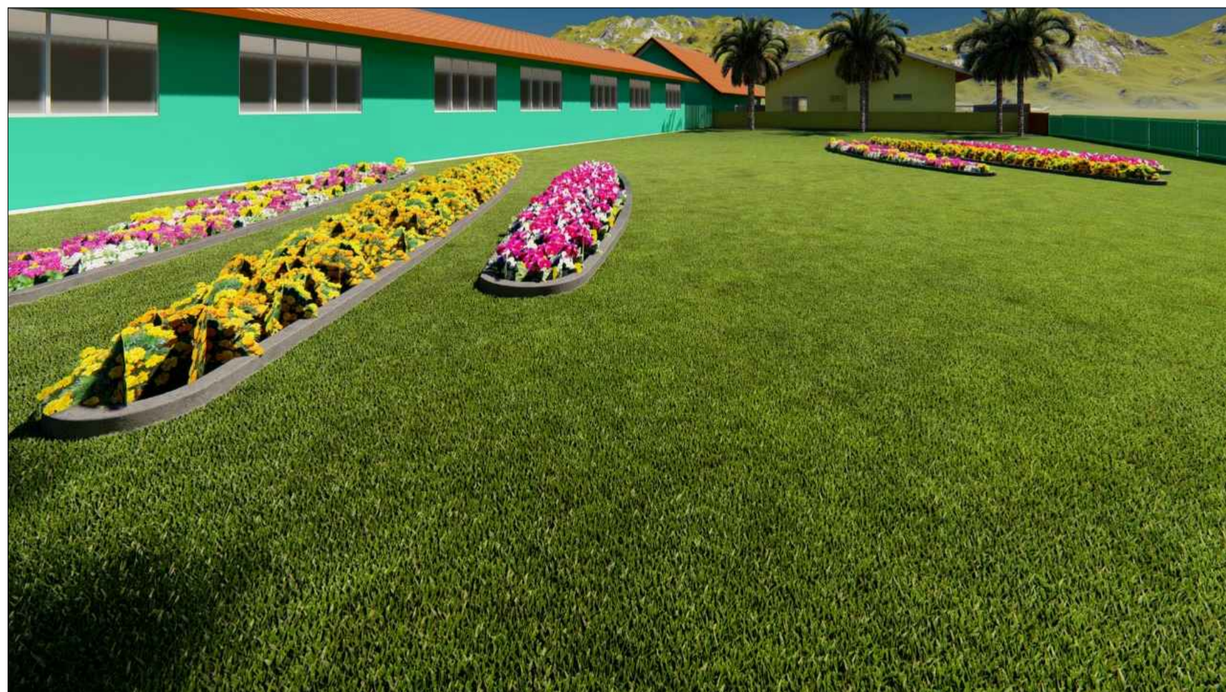
PERSPECTIVA 3D SEM ESCALA