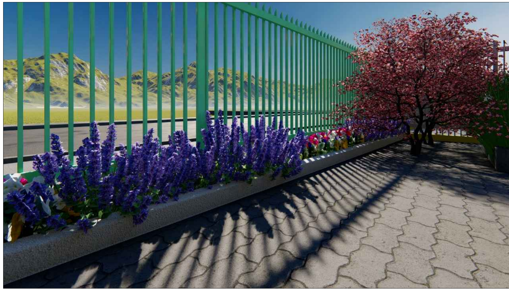
PERSPECTIVA 3D SEM ESCALA