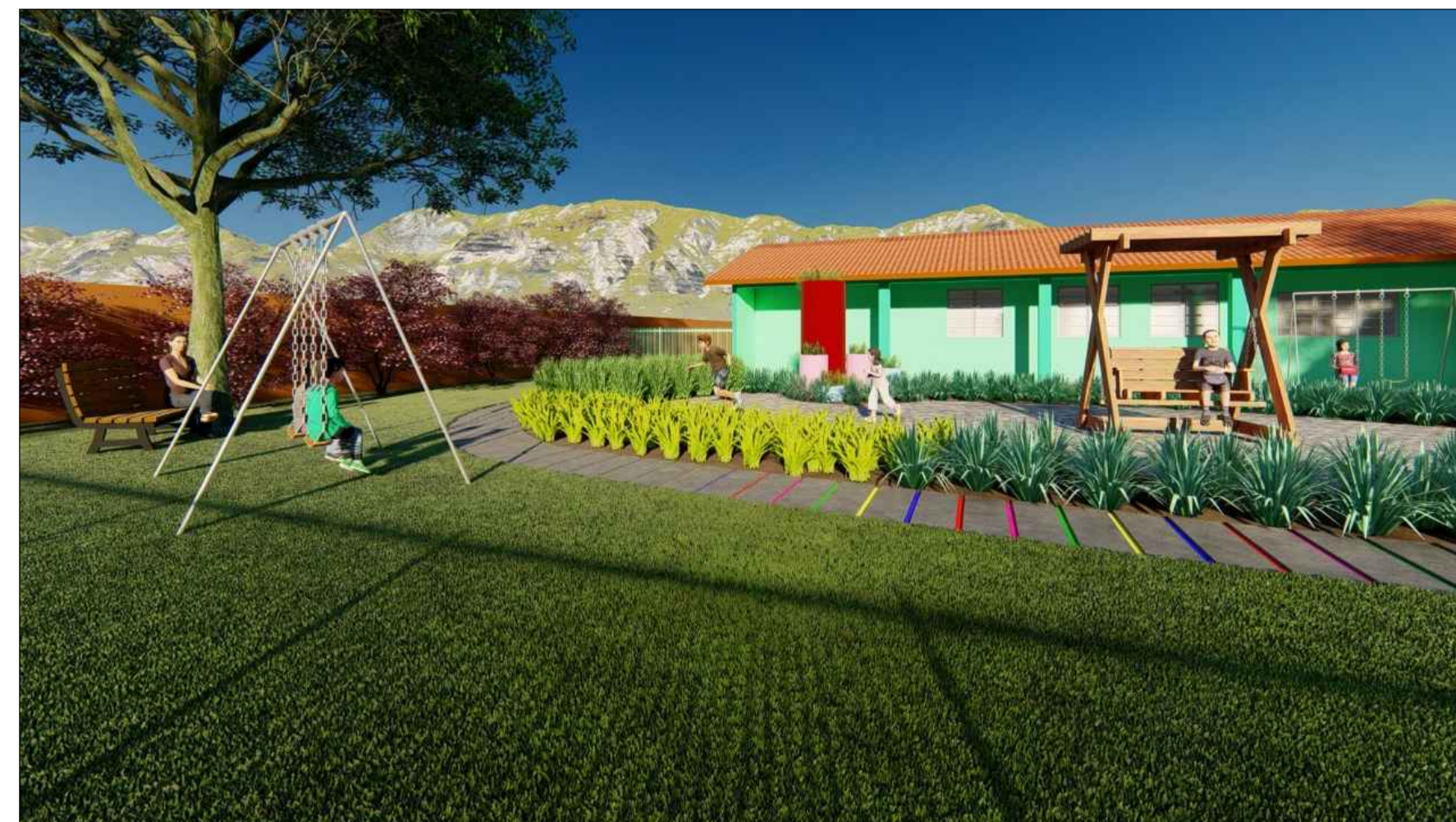
PERSPECTIVA 3D SEM ESCALA