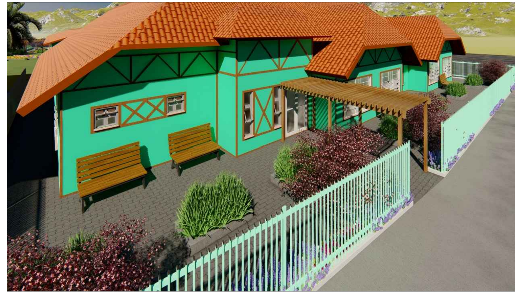
PERSPECTIVA 3D SEM ESCALA