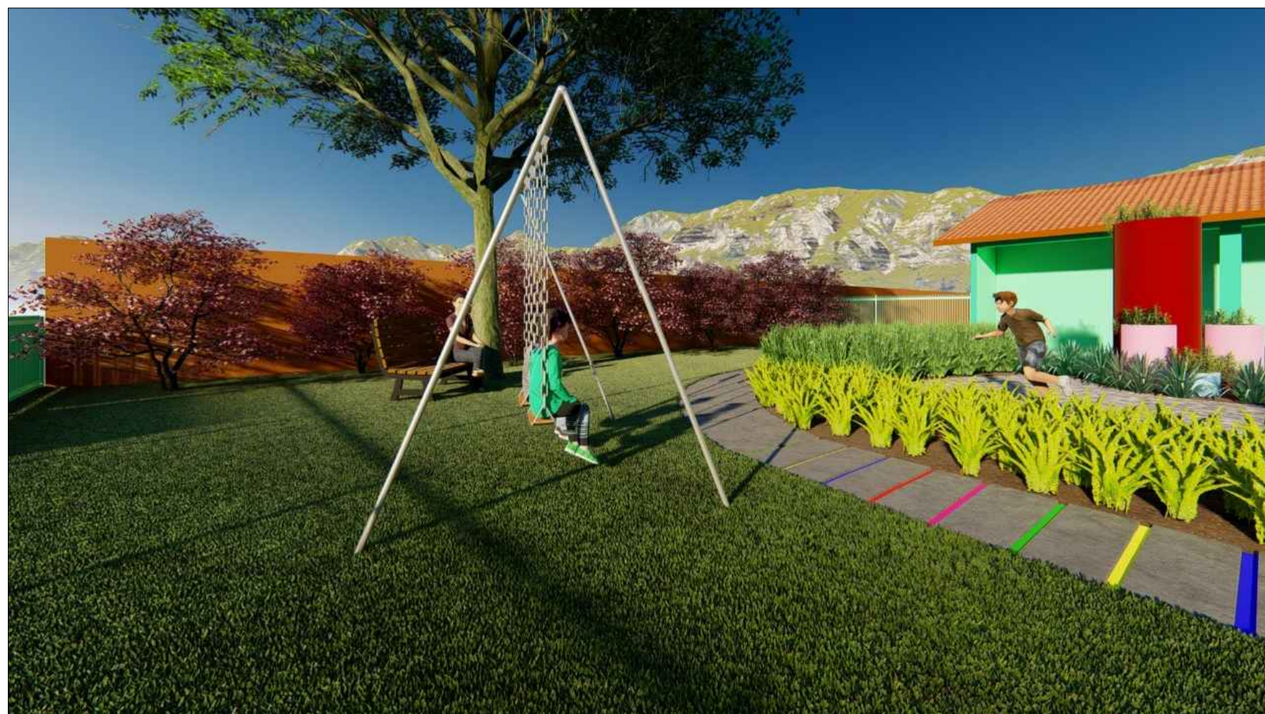
PERSPECTIVA 3D SEM ESCALA