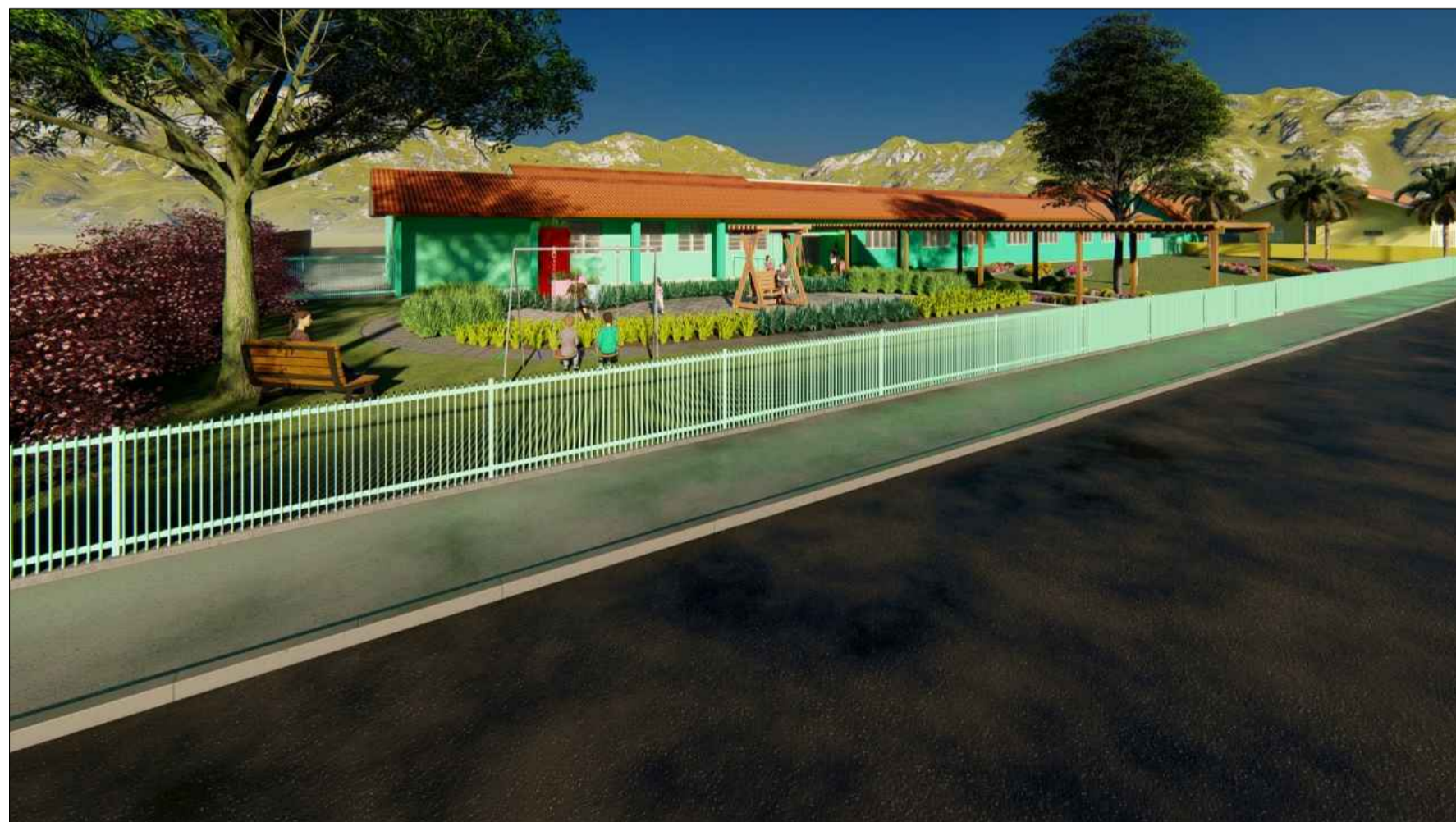
PERSPECTIVA 3D SEM ESCALA