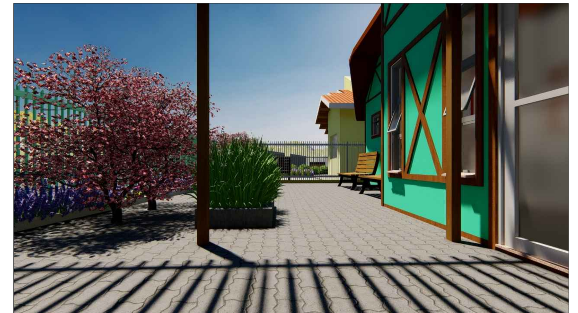
PERSPECTIVA 3D SEM ESCALA