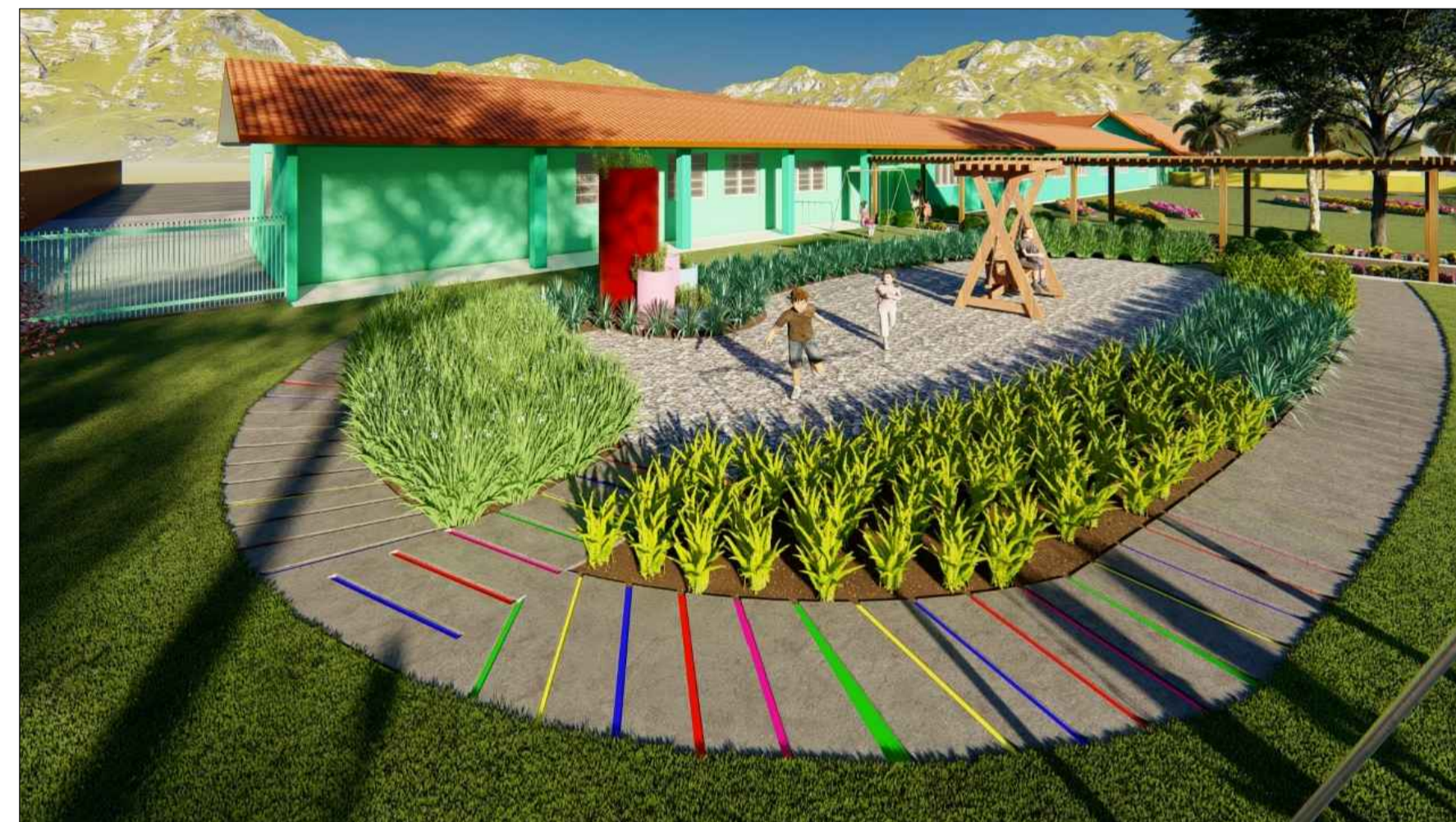
PERSPECTIVA 3D SEM ESCALA