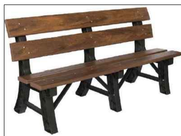
BANCO MADEIRA PLÁSTICA COM ENCOSTO SEM ESCALA