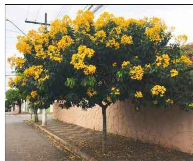
BOLÃO DE OURO SEM ESCALA