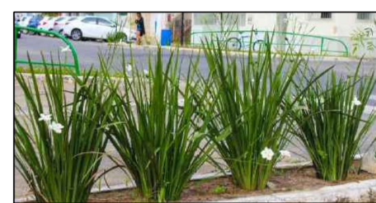
MOREIA BRANCA SEM ESCALA