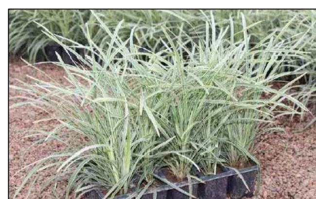
LIRIOPES VARIEGATA SEM ESCALA