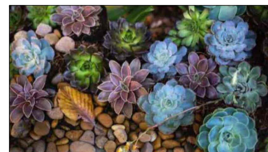
SUCULENTAS SEM ESCALA