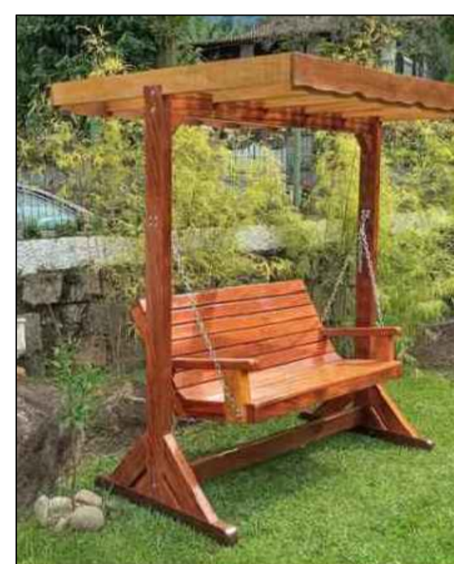
BANCO EM BALANÇO NAMORADEIRA SEM ESCALA