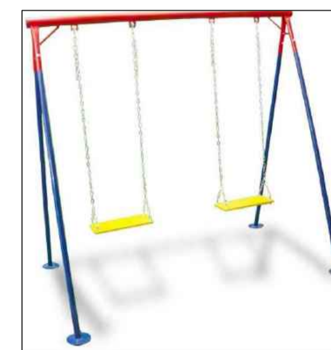
BALANÇO DE AÇO SEM ESCALA