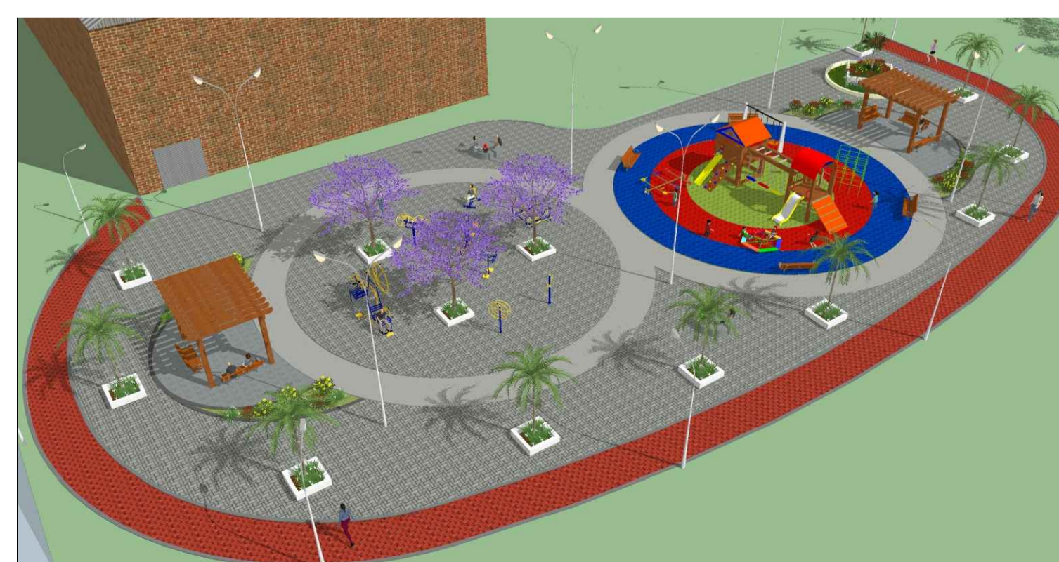
PERSPECTIVA 3D Sem escala