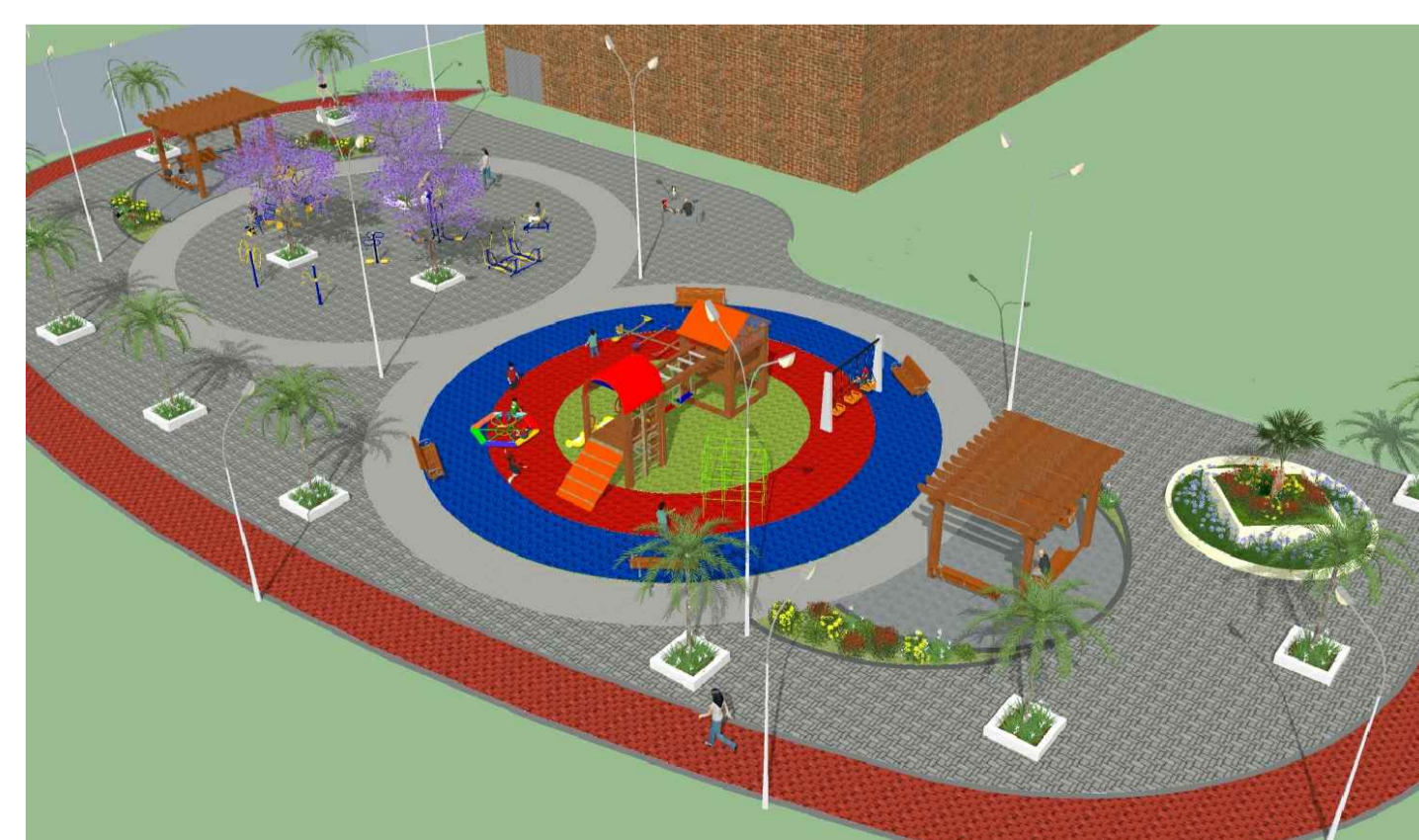
PERSPECTIVA 3D Sem escala