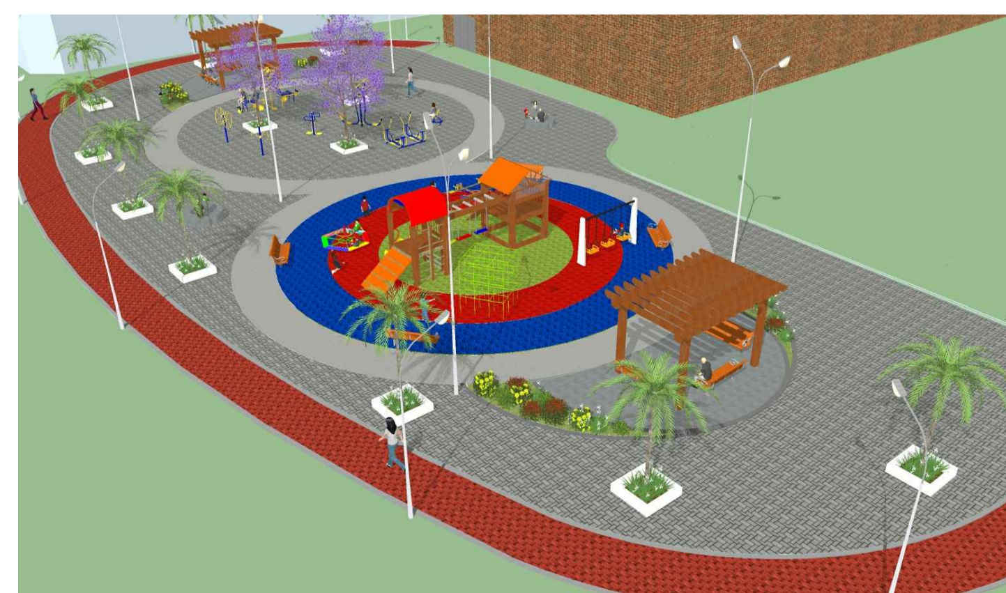
PERSPECTIVA 3D Sem escala