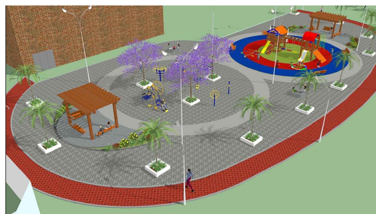
PERSPECTIVA 3D Sem escala