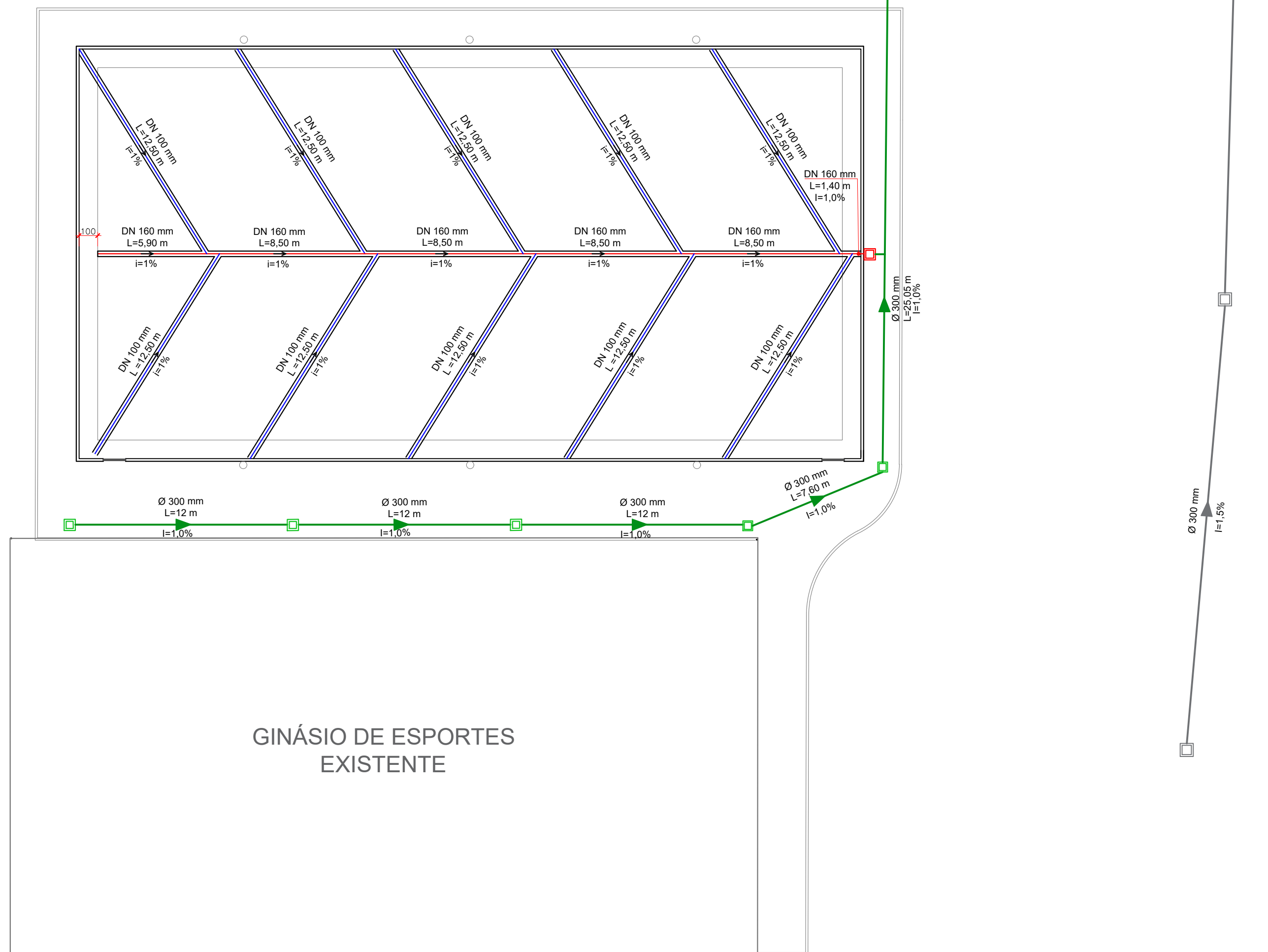
PLANTA DE DRENAGEM Escala 1:200